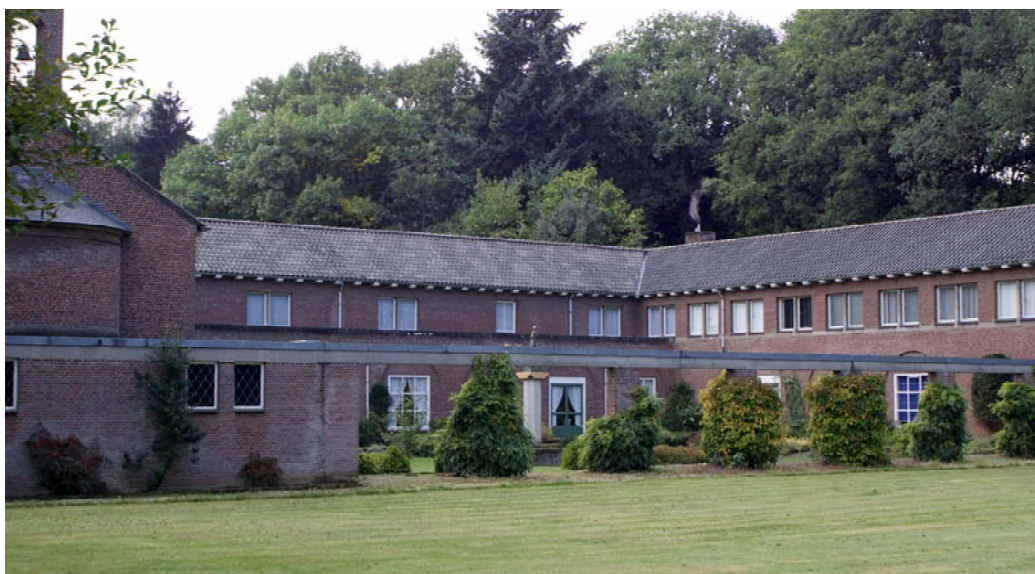
Het klooster aan de Heinsbergerweg in Roermond.